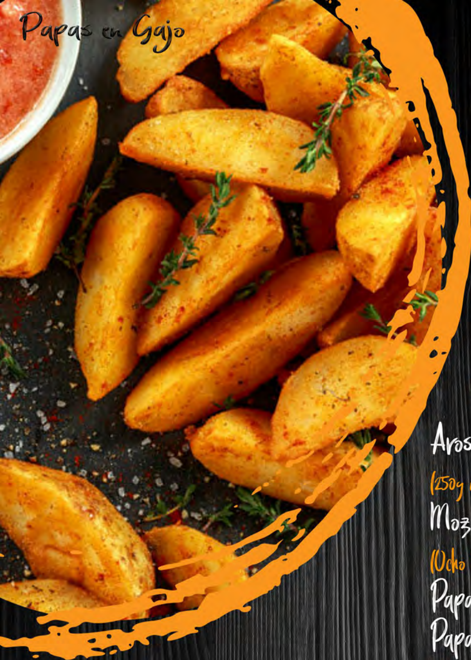
Papas en Gajo