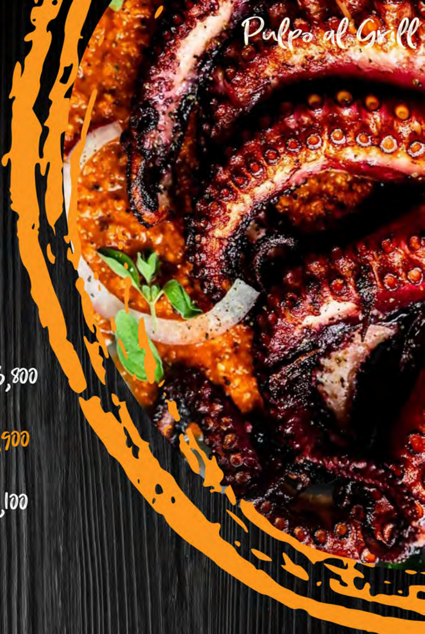
Pulpo al Grill